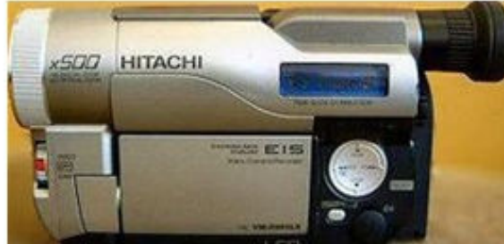
Hitachi Digital8 Camcorder