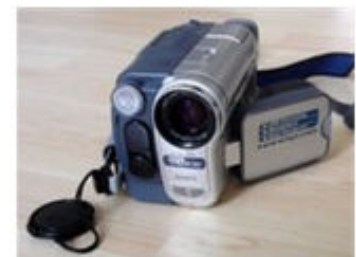
Sony DV Handycam