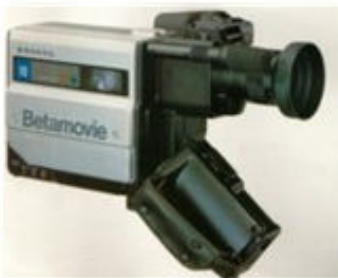
The First Camcorder, 1983

Macam-macam camcorder: miniDV, DVD camcorder, dan digital8.